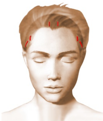
incisions = cicatrices

Elles font entre 5 et 10 mm, sont au nombre de trois à cinq, et sont placées dans le cuir chevelu, quelques centimètres en arrière de la lisière des cheveux du front.